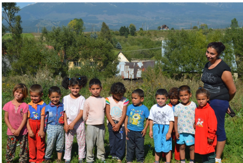
Detský klub Samuel, NDS HD