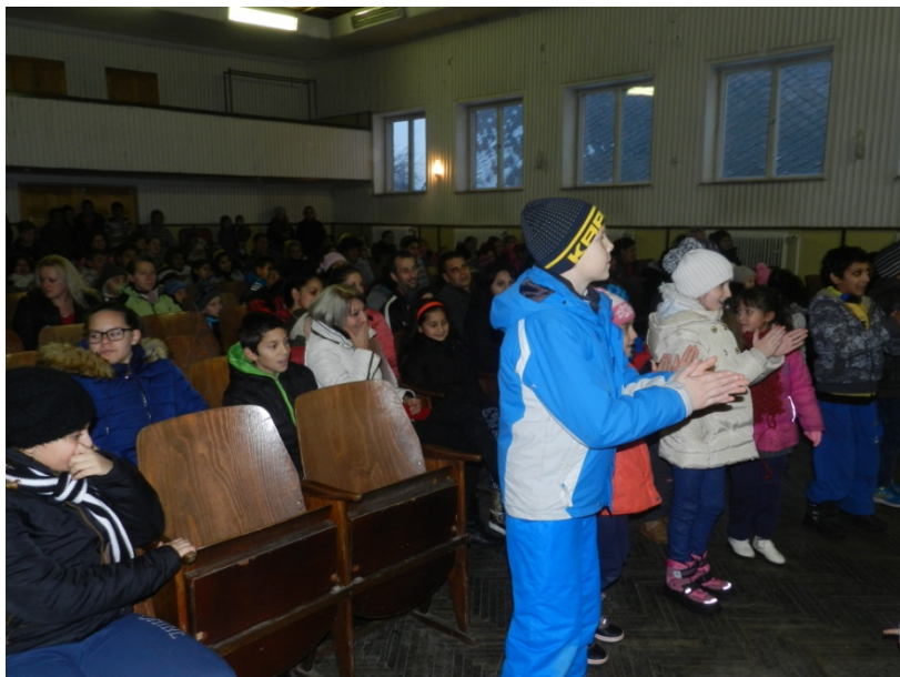
Program „Operácia Vianočné dieťa“