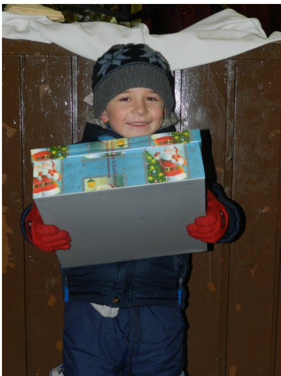
Program „Operácia Vianočné dieťa“