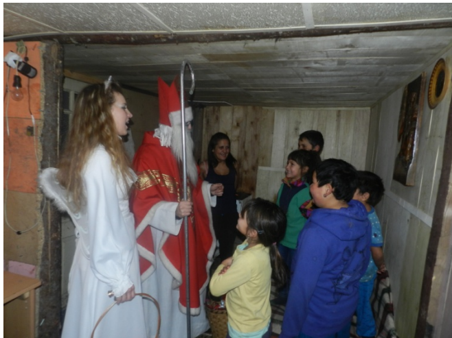
Návšteva Mikuláša v rodinách