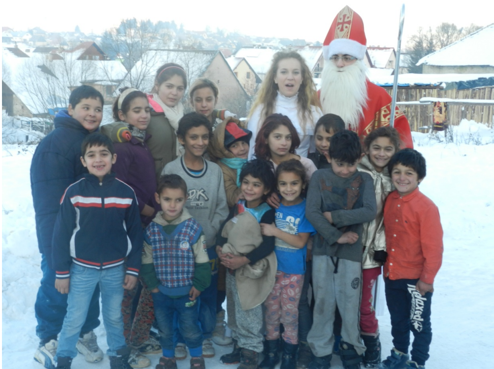
Mikulášsky tím s deťmi