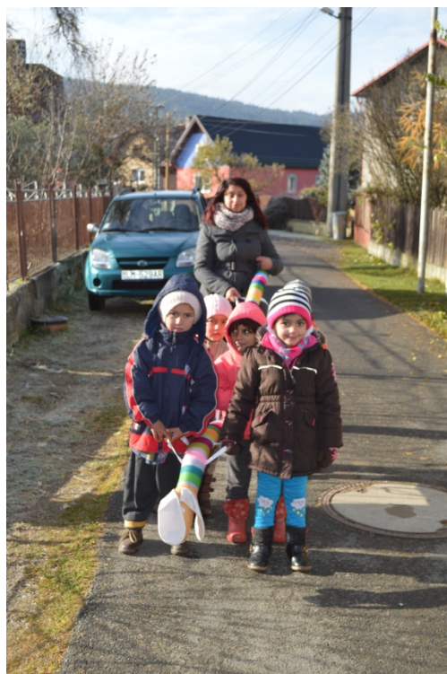
Detský klub Samuel, NDS HD