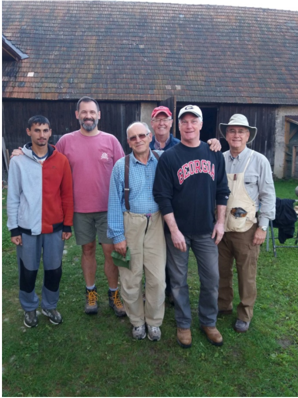
CBF Athens - september 2018